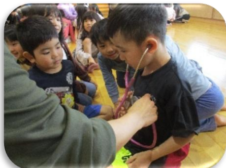
いのちの教育（5歳児）

園児の健康状態の把握や感染症発生の連絡など、コドモンお知らせ配信や感染ボードを通して保護者と共有を行った。