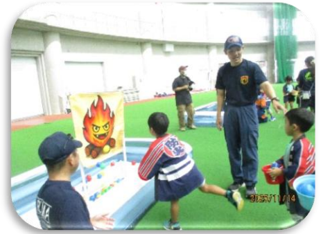
うるま市消防フェスタ参加

毎月1回避難・消火訓練を実施し、「自分の命は自分で守る」ことの大切さを子ども達にも伝えながら、職員・園児ともに真剣に取り組んだ。また、5歳児はうるま市消防フェスタに参加し、消防士とともに煙体験や放水体験等、楽しみながら防災について学ぶことができた。