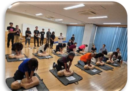
小学校と合同研修(心肺蘇生法)

保育の専門性や質の向上を目的に、園内外の研修やキャリアアップ研修等へ参加しました。研修で得た学びは園内研修の中で報告を行い、全職員で共有することで園全体の資質向上につながりました。