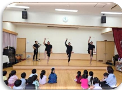
平安名青年会 OB によるエイサー