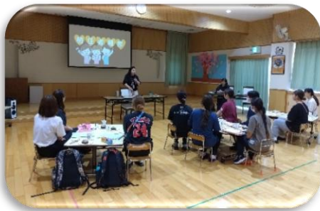
かなさ福祉会 初任保育者研修