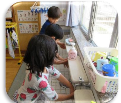
手洗いで感染症の予防