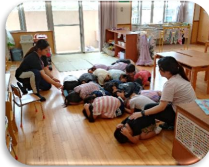
地震訓練：頭を守るダンゴムシのポーズ