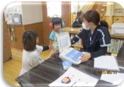
就学前検診 聴力検査