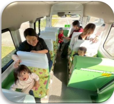
園バスに乗って遠足