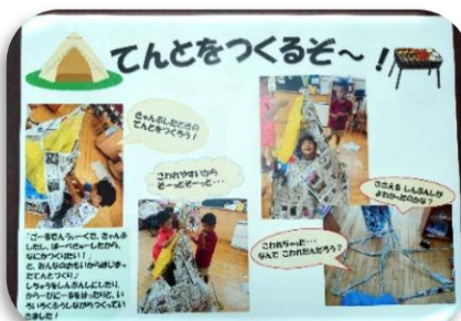
日々の保育の様子をコドモンで保護者へ配信