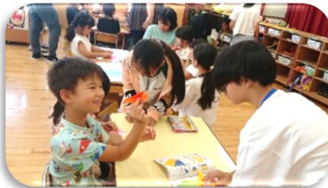
小学生と一緒に折り紙あそび