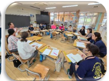
勝連小学校区連絡会

運動場やプールなどの学校施設を利用させていただき、子ども達も小学校を身近に感じる貴重な体験となった。連絡会では近隣の保育施設職員や小学校の先生方と情報共有や地域の課題等について共有を行った。今年度初めて勝連小学校の運動会へ5歳児が参加し、1年生と一緒に玉入れを経験したことが大きな喜びとなり、小学生への憧れや就学への期待感につながりました。