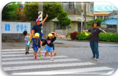
横断歩道の渡り方