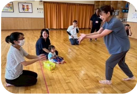
親子一緒にリトミック