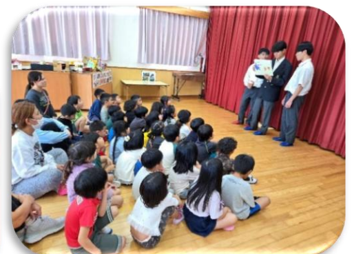
高校生による「うちなーぐち絵本」読み聞かせ

実習生や高校生との交流を通し、子ども達がともに遊ぶ楽しさや安心感を得るだけでなく、普段と違う大人との関わりの中でコミュニケーション力や優しい思いやりの心を育む貴重な体験となった。職員の実習生への助言や指導を行う過程で自身の保育実践や子どもへの関わり方を客観的に振り返る契機となった。