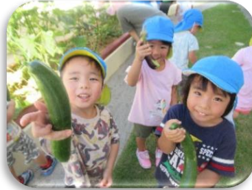
きゅうりの収穫体験