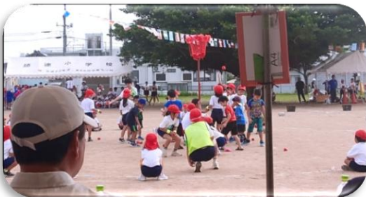
勝連小学校運動会 1年生と一緒に玉入れ