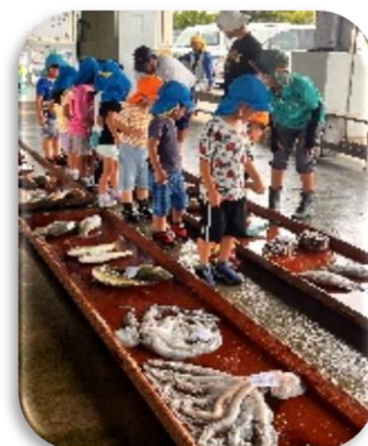
平敷屋漁港 競市場見学