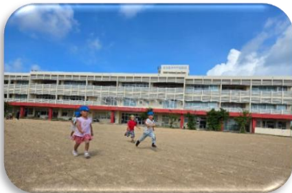
運動場でかけっこ