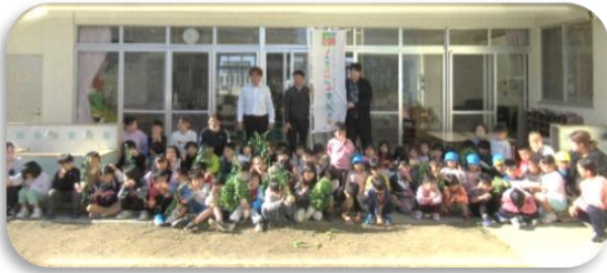
JA 勝連さんから野菜をいただきました