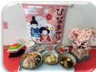
わくわく楽しい行事食