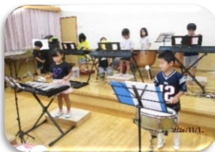
キッズオーケストラ