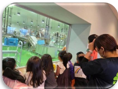
勝連もずく加工施設工場見学