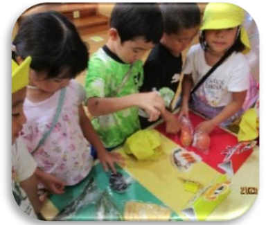
赤・黄・緑の食材を展示