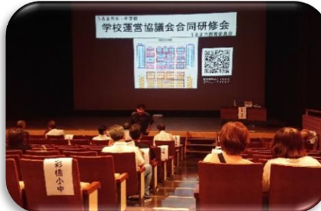
学校運営協議会合同研修会