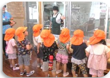
調理員との触れ合い