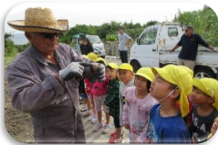
理事長先生からジャガイモの植え方の説明を聞いています