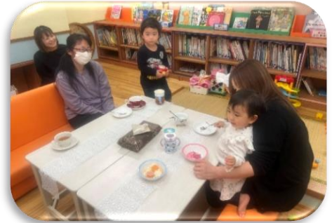
楽しいティータイム「愛カフェ」

地域の子育て世帯を対象に、園庭開放や行事体験、遠足等を実施しました。講師を招いて開催した3園合同のリトミックには地域の親子が参加し、身体を動かす楽しさを共有するとともに保護者同士の交流の輪を広げる貴重な体験となりました。また、「愛カフェ」ではティータイムを交えたリラックスした雰囲気の中で育児相談や雑談の場を設け、保護者のリフレッシュにつながる時間を共有することができました。