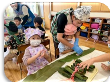
JA 勝連女性部とムーチー作り