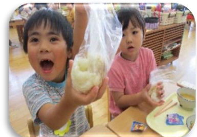
おにぎり作りに挑戦

「楽しく食べる」ことを目標に旬の食材や季節の行事食などのメニューを提供しました。アレルギー除去食については、保育教諭と調理員が共通理解を図りながら誤嚥・誤食防止に努めました。また、保護者への情報提供として栄養士が作成した「食育だより」や園発行の「もぐもぐだより」で園での食への取り組みや関心を深められるようにしました。