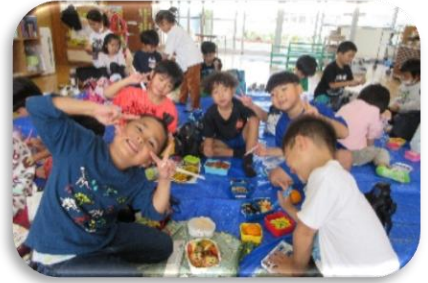
みんなで食べる喜び

園児が食への関心を高め望ましい食習慣を身につけることを目的に食育活動に取り組んだ。栽培・クッキング・地域の農家さんからいただいた野菜の給食提供で食への意欲向上と偏食の改善に成果を感じた。